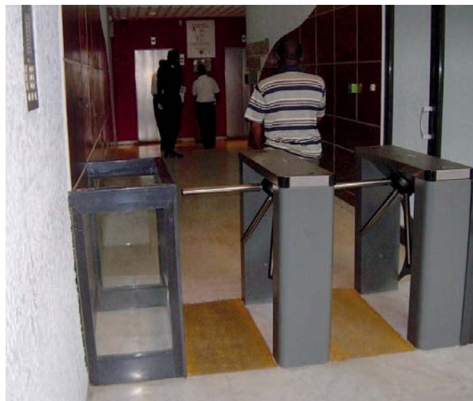
Zicht op toegangscontrole met een drie-armig draaikruis

Volgens de verantwoordelijke van de société générale des banques au Cameroun (Sgbc) deed men er goed aan om een beroep te doen op IDtech voor de beveiliging van het gebouw: “IDtech biedt bedrijven en openbare instellingen een complete en geïntegreerde oplossing aan inzake beveiliging en personeelsbeheer. IDtech biedt en ontwikkelt een compleet gamma producten die hardware en software combineren om de veiligheid van de sites en het tijdsbeheer van het personeel te optimaliseren. IDtech biedt eveneens een reeks diensten aan, gaande van behoefteanalyse tijdens de uitwerking van het project, naar opleiding op maat met behulp van parametrisatie van de oplossing, tot de opvolging van de installatie. Dit zijn belangrijke toegevoegde waarden die overeenstemmen met veiligheidsnormen binnen de financiële instellingen.”