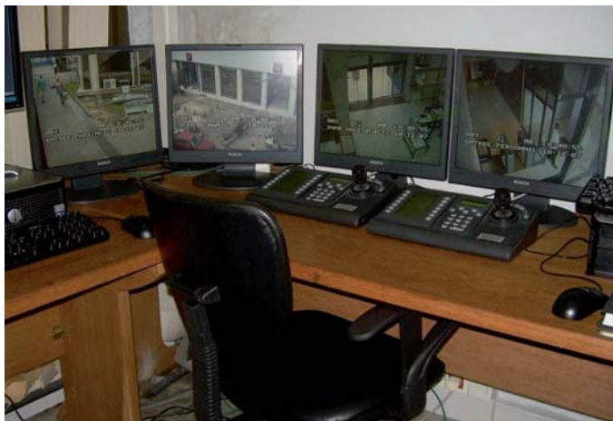
Afbeelding van een controle- en bewakingspost

ander voordeel: geen onverwachte bezoeken meer, waardoor men vroeger vaak onnodig tijd verloor. Via dit toegangssysteem wilden de verantwoordelijken van de Sgbc zich onderwerpen aan de moderne vereisten in termen van elektronische beveiliging van gebouwen. Dankzij de toegangscontrole kan het risico op indringers, en dus ook op gevaarlijke situaties, fraude en grote diefstallen, zo goed mogelijk ingeperkt worden.