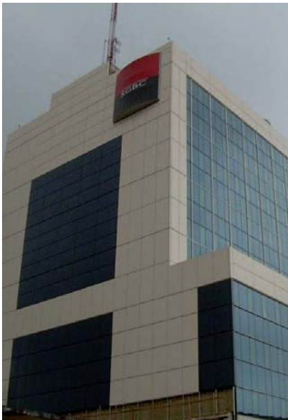
Het beveiligde gebouw van de Sgbc